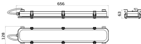
Рисунок 1 Светильник «L-sub 45»